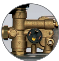
Латунная гидравлическая группа